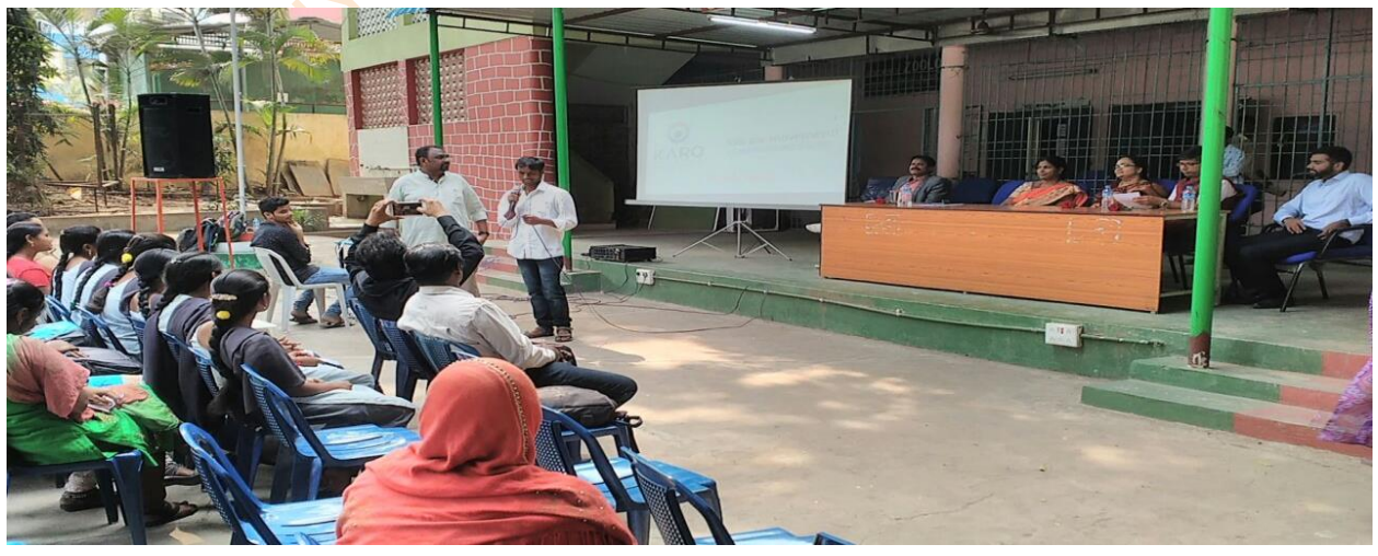
KaroSambhav Guide Foundation E- waste Management